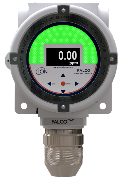
Modelo TAC difuso (10.0eV)