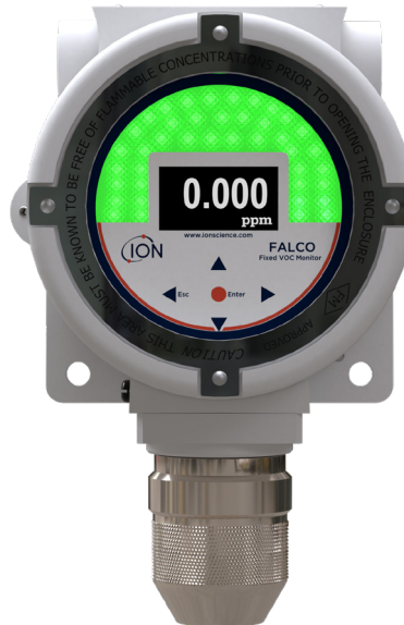
Modelo de 10,6 eV difuso

Registre su producto en línea en el plazo de un mes tras su compra para aumentar su garantía. Visite ION Science.